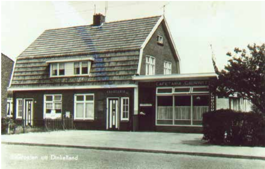
'Cafetaria Gerrit' (Game) aan de Hoofdstraat in 1960. Willem Game was hierbij zeer betrokken. Het groeide in de latere generaties uit tot het horecacomplex met het Grenshistorisch Smokkel- en Textielmuseum, dat op 16 augustus 2012 door brand werd verwoest.