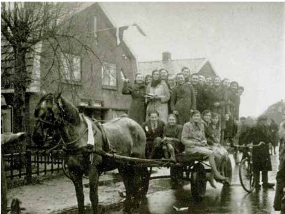
Bevrijdingsoptocht in Overdinkel.

http://www.historischekringlosser.nl/orgaan/teksten/2010-3.pdf ).