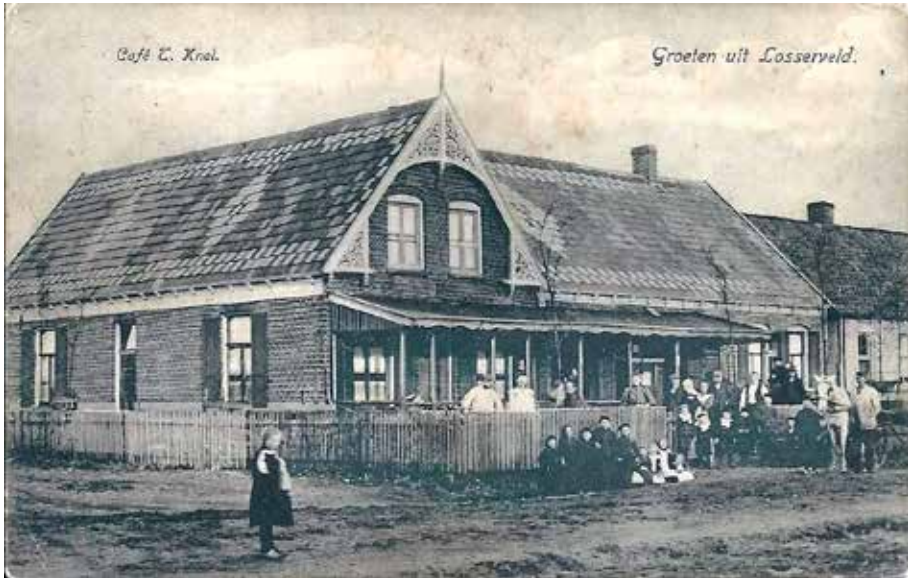
Café Knol aan de Hoofdstraat, rond 1900, was de basis van een zakenimperium van horeca en winkels, waaraan in de tachtiger jaren van de vorige eeuw een einde kwam.