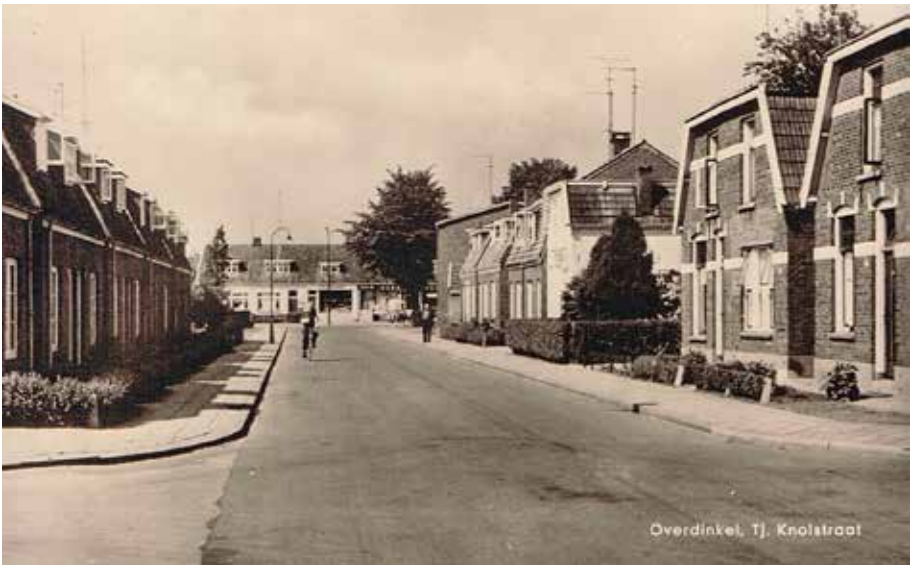
Kruising Julianastraat/Tjibbe Knolstraat, op deze foto al afgebouwd. De 'bult zand' is verdwenen.

Foto's die mooi weergeven hoe Overdinkel veranderde in een mensenleven.