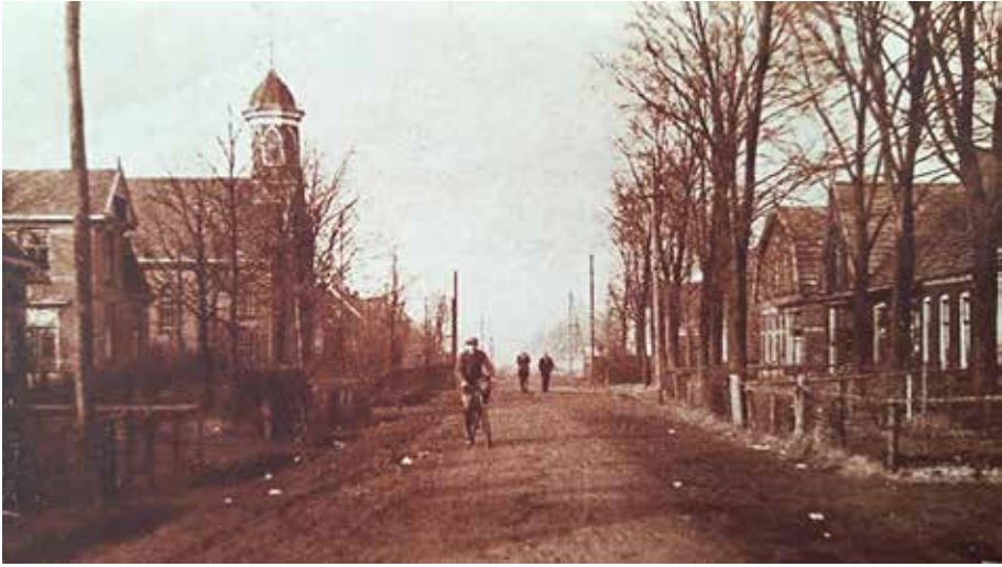
De Hoofdstraat bij de protestantse kerk.

Foto's die mooi weergeven hoe Overdinkel veranderde in een mensenleven.