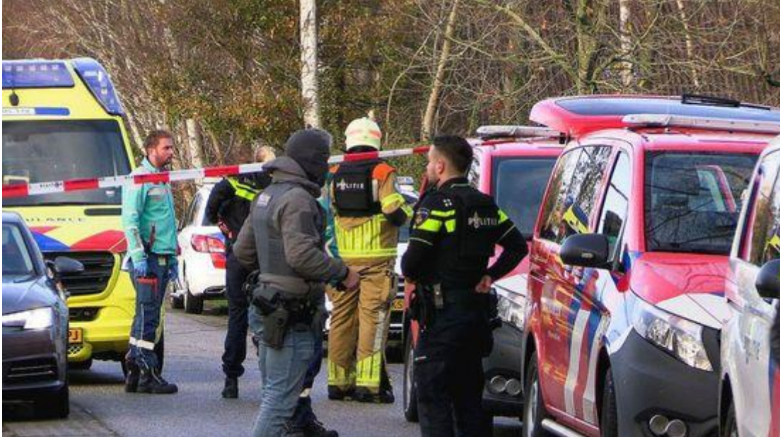
De hulpdiensten in actie na de ontdekking van de cokewasserij in Overdinkel

In de Overdinkelse cocaïneschuur die eind november werd ontdekt, werd cocaïne uit 'superfood' chiazaad gehaald. Dat blijkt uit onderzoek van RTV Oost. Uit berekeningen van een gespecialiseerd politieteam blijkt dat er in de Twentse schuur ruim 5000 kilo coke is 'geproduceerd' met een handelswaarde van minimaal 100 miljoen euro.